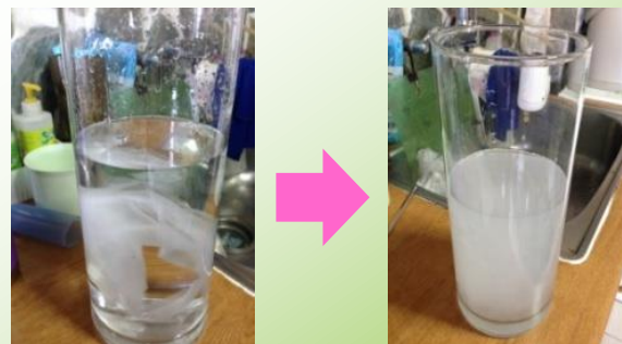
衛生紙於水中狀態

研究顯示，衛生紙投入馬桶增加之固形物沈澱量，對建築物污水處理設施（化糞池）或公共下水道初沉設施有效容積之影響試驗，顯示 投入衛生紙至馬桶不但不會造成堵塞，而且經沖水後已發生破碎 ； 但誤用面紙取代衛生紙投入馬桶時，不但不易破碎發生，而且也因此容易造成馬桶堵塞 （無論是否與污物一併投入馬桶），其主要原因係因面紙中添加了 濕強成分 ，不易分散破碎。