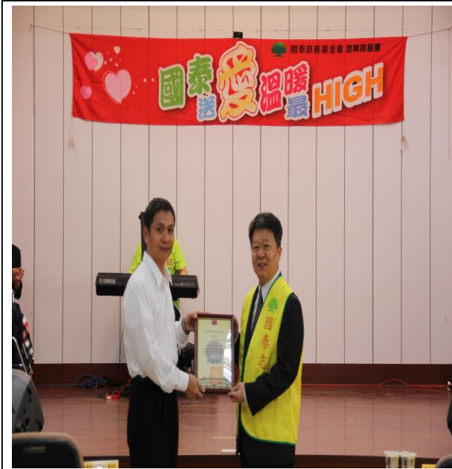
秘書親臨致詞並致贈感謝狀