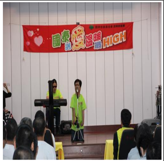
肢障歌手演唱「心頭肉」唱出對母親不離不棄的感謝之意