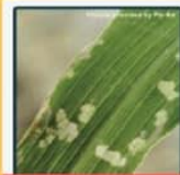
1齡幼蟲造成透明窗格紋啃食痕跡