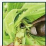
偏好啃食作物生長點, 受害處留下大量糞便