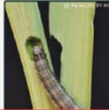
老熟幼蟲蛀食莖稈