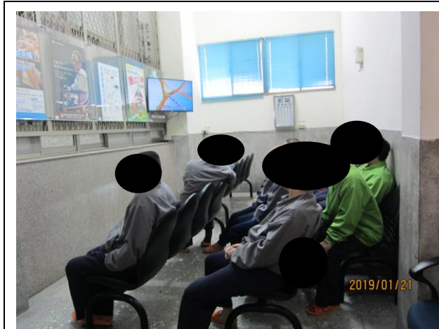
菸害防治影帶宣導 1