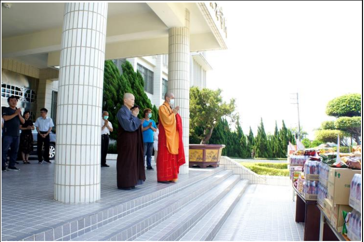
念誦經文·消災祈福