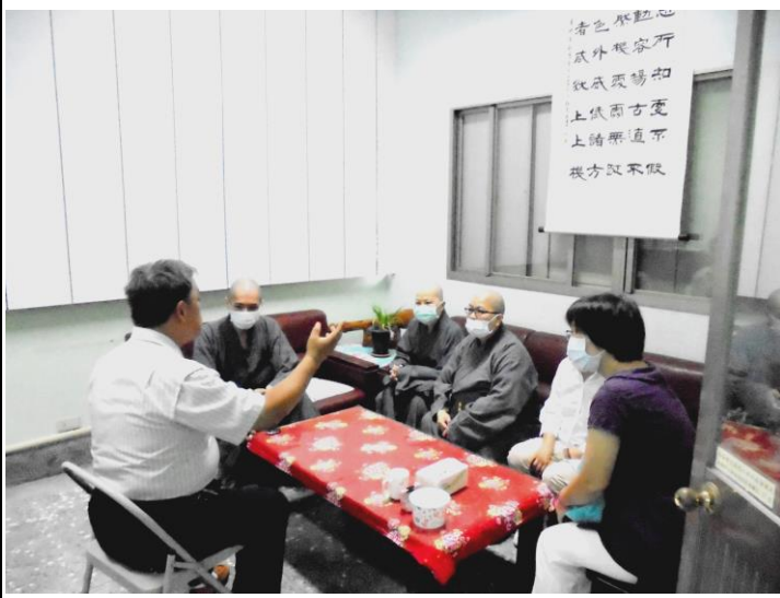
與法師討論流程事項