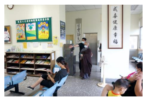
全所灑淨·救度眾生