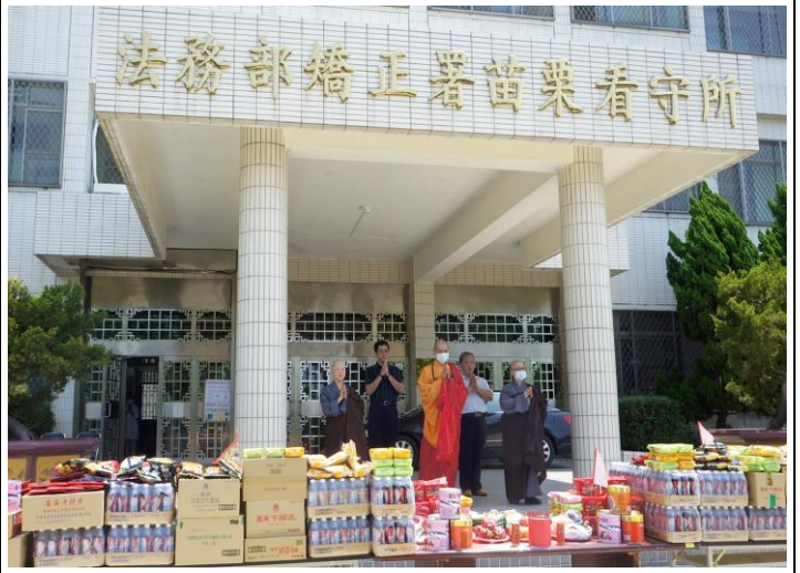
功德圓滿·迴向眾生