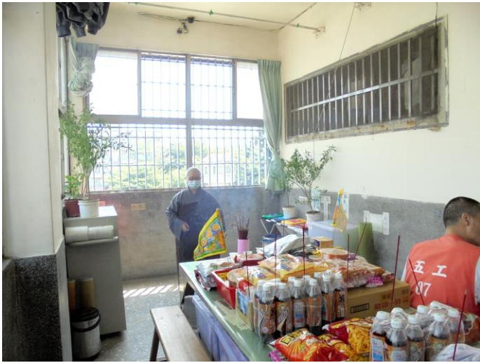
各場舍均設普渡桌祭拜