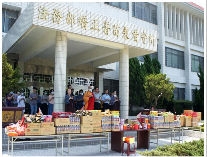
所長與法師帶領同仁祭拜