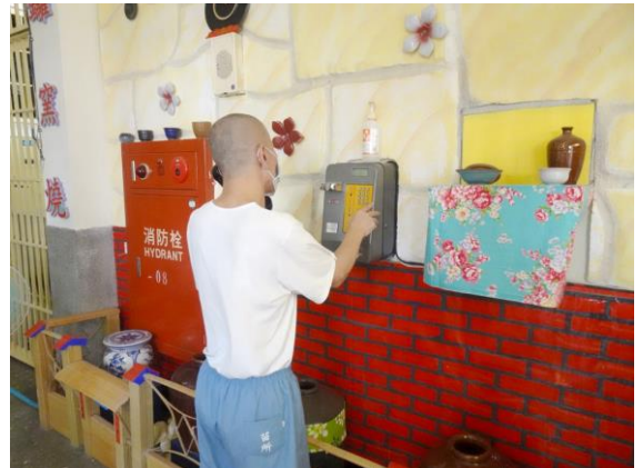
於各場舍辦理電話懇親