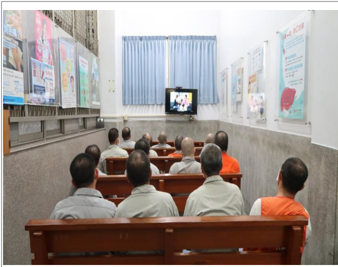
流行性疾病影帶宣導